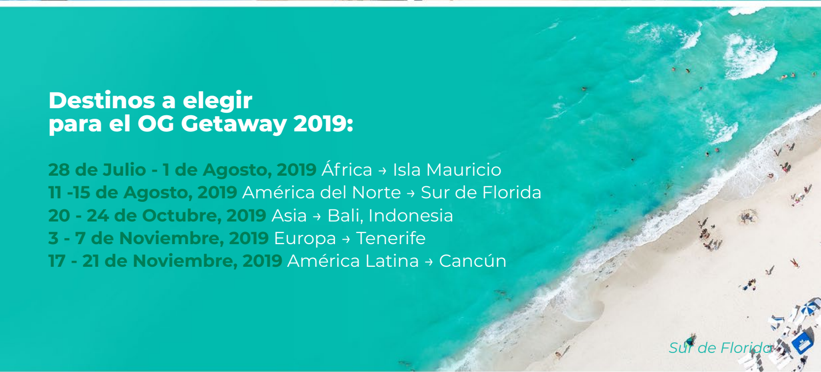
Sur de Florida

17 - 21 de Noviembre, 2019 América Latina → Cancún